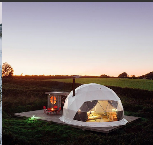
قابل استفاده در اقلیم های مختلف